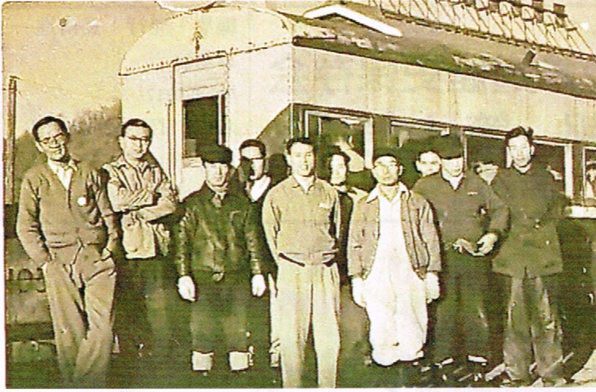
野村鋳業イトムカ鋳山の鉄道車両